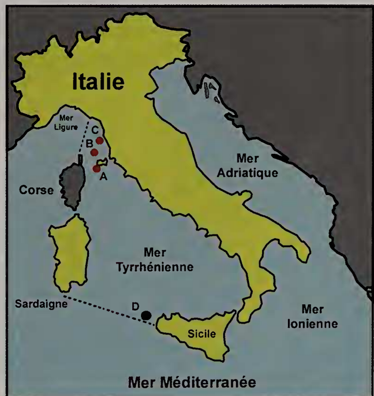
Figure 1. A-D. Mer Tyrrhénienne A. Ile d'Elbe. B. Ile de Capraia. C. Calignaia. D. Favignana

Basé sur les six spécimens connus à ce jour, les caractères principaux de l'espèce se résument comme suit (Romani, 2015): coquille de petite taille (4,7 - 6,1 mm), protoconque blanchâtre de 2,7 - 3 tours, portant deux cordes spirales croisées de nombreuses fines côtes axiales, à partir du deuxième tour. La sculpture sur la partie visible de la téléconque est formée de 3 cordons spiraux noduleux (ici C1-C3), le premier (C1) et le troisième cordon (C3) font immédiatement suite à la protoconque. Le deuxième cordon (C2) apparaît entre les deux premiers à la hauteur des tours 5,5 - 7,5. Il demeure relativement fin et ce n'est que sur le dernier tour qu'il atteint une grosseur comparable aux autres. La base de la coquille porte 4 cordons additionnels (ici C4-C7) dont le premier, bien développé, est noduleux, les trois suivants, d'épaisseur décroissante à mesure de leur apparition sur le canal siphonal, sont lisses. La couleur de la téléconque est uniformément crème, tant sur les cordons qu'entre ceux-ci, à l'exception de la base de la coquille qui est plus brune.